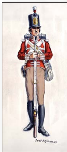
104e régiment de fantassins

Une histoire qui a comme toile de fond la guerre de 1812 et qui se situe plus précisément au cours de l'hiver 1813, notable pour ses grands froids et ses fortes chutes de neiges. De février à avril, le 104e régiment de fantassins quitte Fredericton, au Nouveau-Brunswick, pour aller à Kingston, en Ontario, renforcer les troupes britanniques qui s'attendent à une invasion des Américains. Mal vêtus et mal chaussés pour ce périple extrême de 1100 kilomètres, ils arrivent à destination affamés et souffrant notamment de multiples engelures. Leur exploit aussi incroyable qu'héroïque s'inscrit dans les annales militaires. Pour rappeler cette page d'histoire remarquable, des géocaches spéciales ont été placées dans une trentaine de sites le long de la rivière Saint-Jean et dans le reste du Nouveau-Brunswick. Les emplacements de géocache représentent soit un endroit où le 104e a occupé un fort, un poste avancé, soit une personne en relation avec le régiment. Lorsque vous trouvez une géocache, vous devez en noter le lieu, la date et le code dans ce passeport. Les 200 premières personnes qui auront trouvé et noté au moins 15 géocaches auront droit à une magnifique géopièce commémorative détectable. Bonne chance!